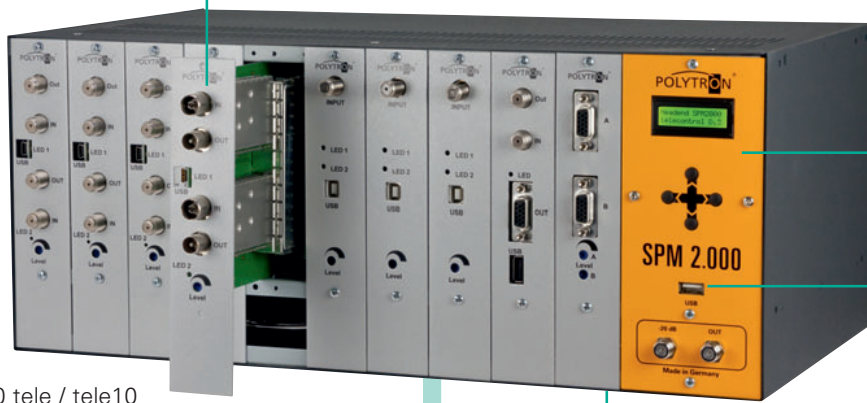
SPM 2.000 tele / tele10

Module leicht austauschbar Easy change of modules