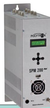
SPM 200 digi

Passendes Netzteil NG 12/3000, Artikel-Nr. 9300610 gleich mitbestellen. Order with power supply unit NG 12/3000, article no. 9300610.